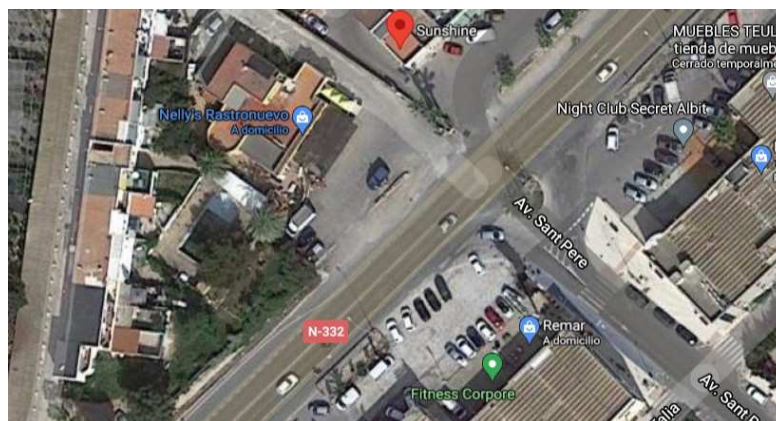
Imágenes aérea de la zona afectada por expropiación

Urbanización y servicios: disponen de servicio rodado y asfaltado, a los efectos del art. 21.3 del TRLS y RU