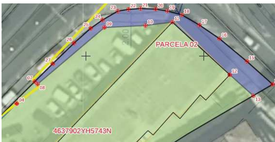
ubicación de los terrenos objeto de valoración

La parcela afectada por las obras ( Parcela 2 ) para la "Mejora de la movilidad urbana entre el centro urbano y la playa del Albir a través de la reordenación del tráfico rodado y la permeabilidad peatonal y cicloturista. Fase III" en l'Alfàs del Pi, se describe en la siguiente imagen: