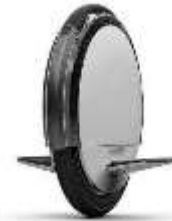
Plataforma 1 rueda

- VMP para el transporte de mercancías u otros servicios (Estos vehículos en ningún caso podrán utilizarse para el transporte de pasajeros). Algunos ejemplos gráficos: