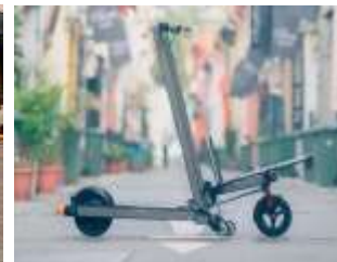
Patinete transporte carga delantera