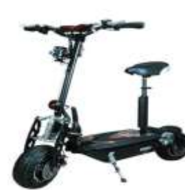
Patinete eléctrico con sillín