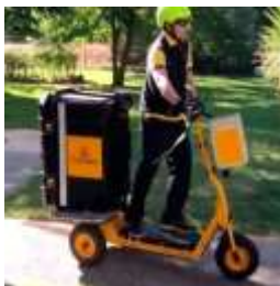
Patinete transporte carga trasera

- VMP para el transporte de mercancías u otros servicios (Estos vehículos en ningún caso podrán utilizarse para el transporte de pasajeros). Algunos ejemplos gráficos: