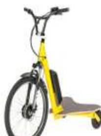
Patinete eléctrico 3 ruedas