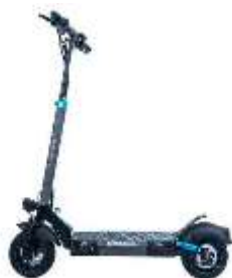
Patinete eléctrico 2 ruedas