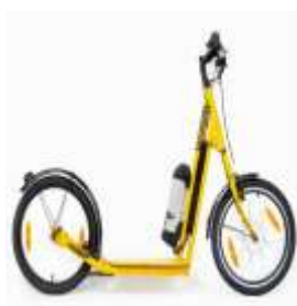
Patinete electrico 2 ruedas