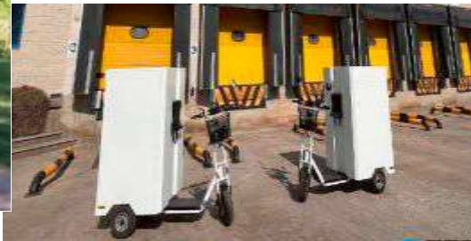
Patinete transporte carga trasera