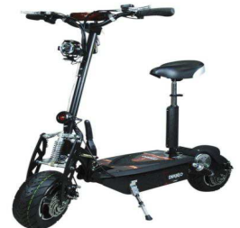
Patinete eléctrico con sillín