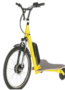
Patinete eléctrico 3 ruedas