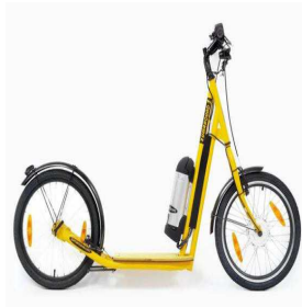
Patinete eléctrico 2 ruedas