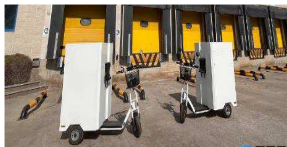
Patinete transporte carga trasera