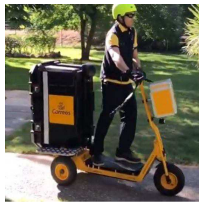
Patinete transporte carga trasera