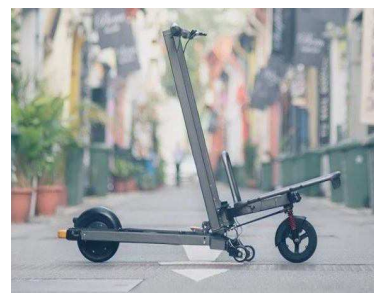
Patinete transporte carga delantera