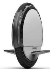
Plataforma 1 rueda