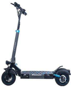
Patinete eléctrico 2 ruedas