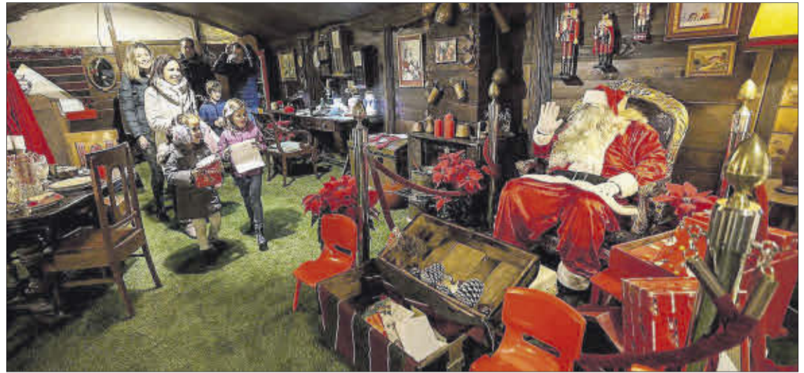
Las primeras visitas llegaron ayer a la Casa de Papá Noel, en la plaza de Séneca.