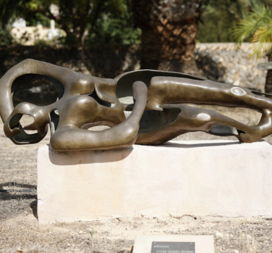
Fundación Klein: Escultura al aire libre y entorno autóctono