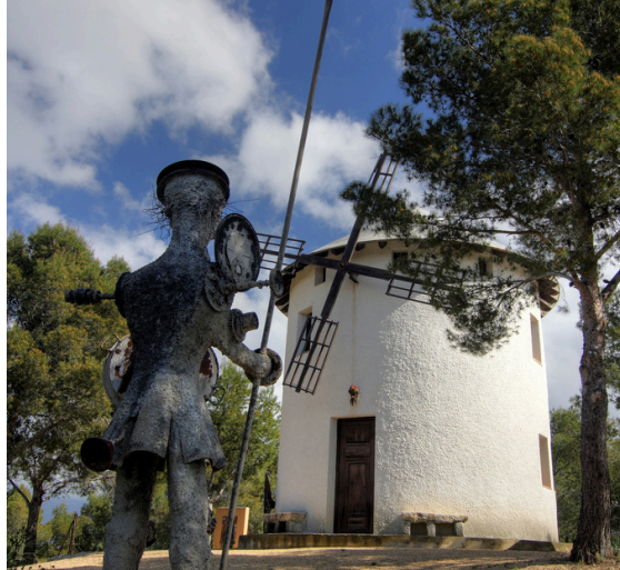
Museo Delso: Un legado artístico cultural

Disponer de esta diversidad de espacios culturales y patrimoniales activos, tanto público como privados, y en red, posiciona a l'Alfàs del Pi como un municipio ejemplar en la gestión integral de su herencia material e inmaterial.