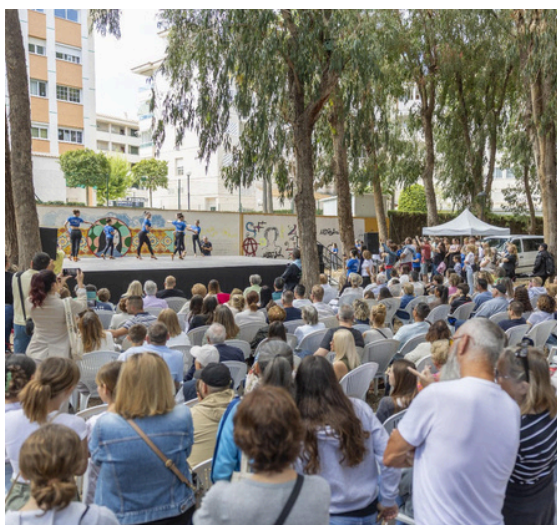
Parcs urbans (Eucalipts, Escandinàvia, Carrascos, Hort): Cultura accessible i a l'aire lliure