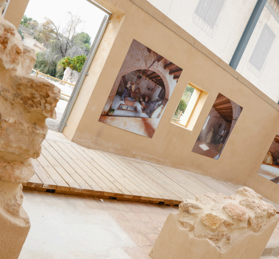
Molí de Màneg: Cultura del aigua

L'Alfàs també cuenta amb una important quantitat d'espais culturals i una xarxa ampla i diversa d'espais culturals la qual representa, per a qualsevol municipi, un actiu estratègic de primer ordre. Més allà de la seva funció com a contenidors d'activitats, aquests espais configuren un ecosistema viu que articula identitat, cohesió social, desenvolupament econòmic i projecció territorial.