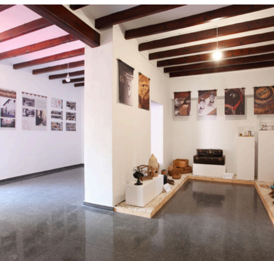
Museo l'Alfàs amb Història: Memòria viva

L'Alfàs també cuenta amb una important quantitat d'espais culturals i una xarxa ampla i diversa d'espais culturals la qual representa, per a qualsevol municipi, un actiu estratègic de primer ordre. Més allà de la seva funció com a contenidors d'activitats, aquests espais configuren un ecosistema viu que articula identitat, cohesió social, desenvolupament econòmic i projecció territorial.