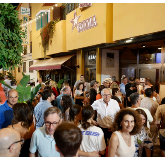
The Comm: Cultura y salud senior en l'Alfàs del Pi