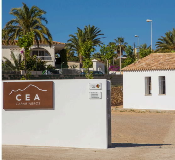
C.E.A Carabineros De la arqueologia pública al art contemporani